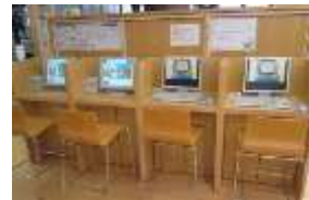
うきは市立図書館 検索 インターネット利用コーナー